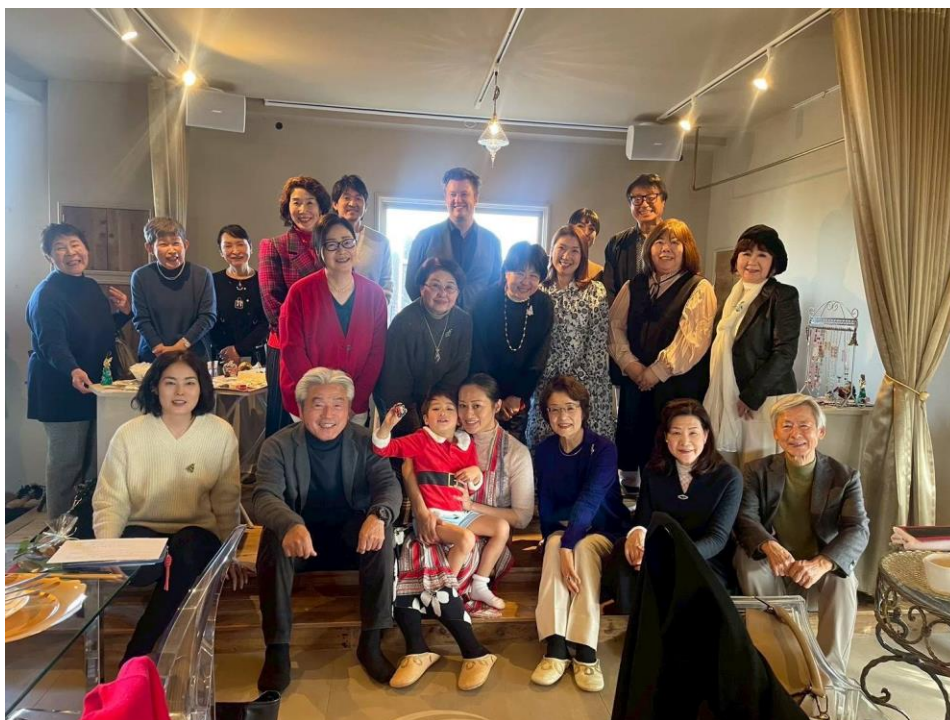
Deelnemers op de eerste dag van de Nederlands-culinaire workshops ten behoeve van de aardbevingsslachtoffers van Wajima.