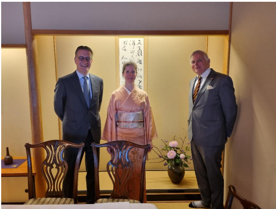
Het bestuur van Waza no Michi tijdens de door Waza no Michi georganiseerde geurenceremonie in de residentiewoning van de ambassadeur van Japan in april 2025 (zie hoofdstuk 6).