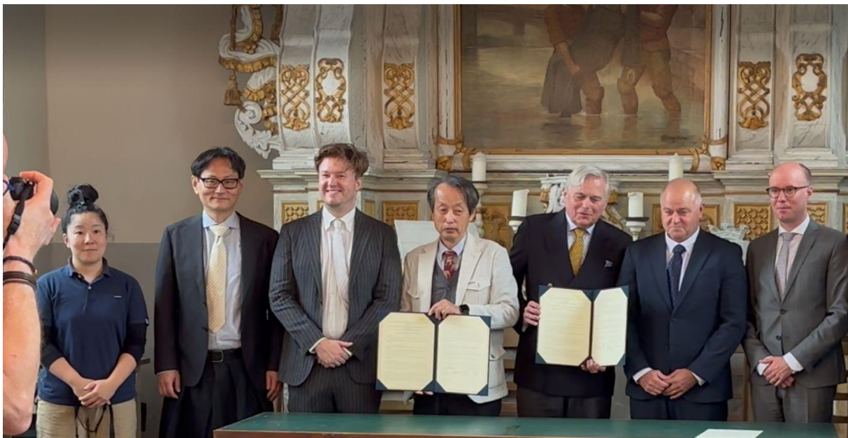
Ondertekening van de samenwerkingsovereenkomst tussen stichting Waza no Michi en vertegenwoordigers van de Universiteit van Toyama, vergezeld van wethouders van Gemeente Land van Cuijk en vertegenwoordigers van de provincie Noord-Brabant.