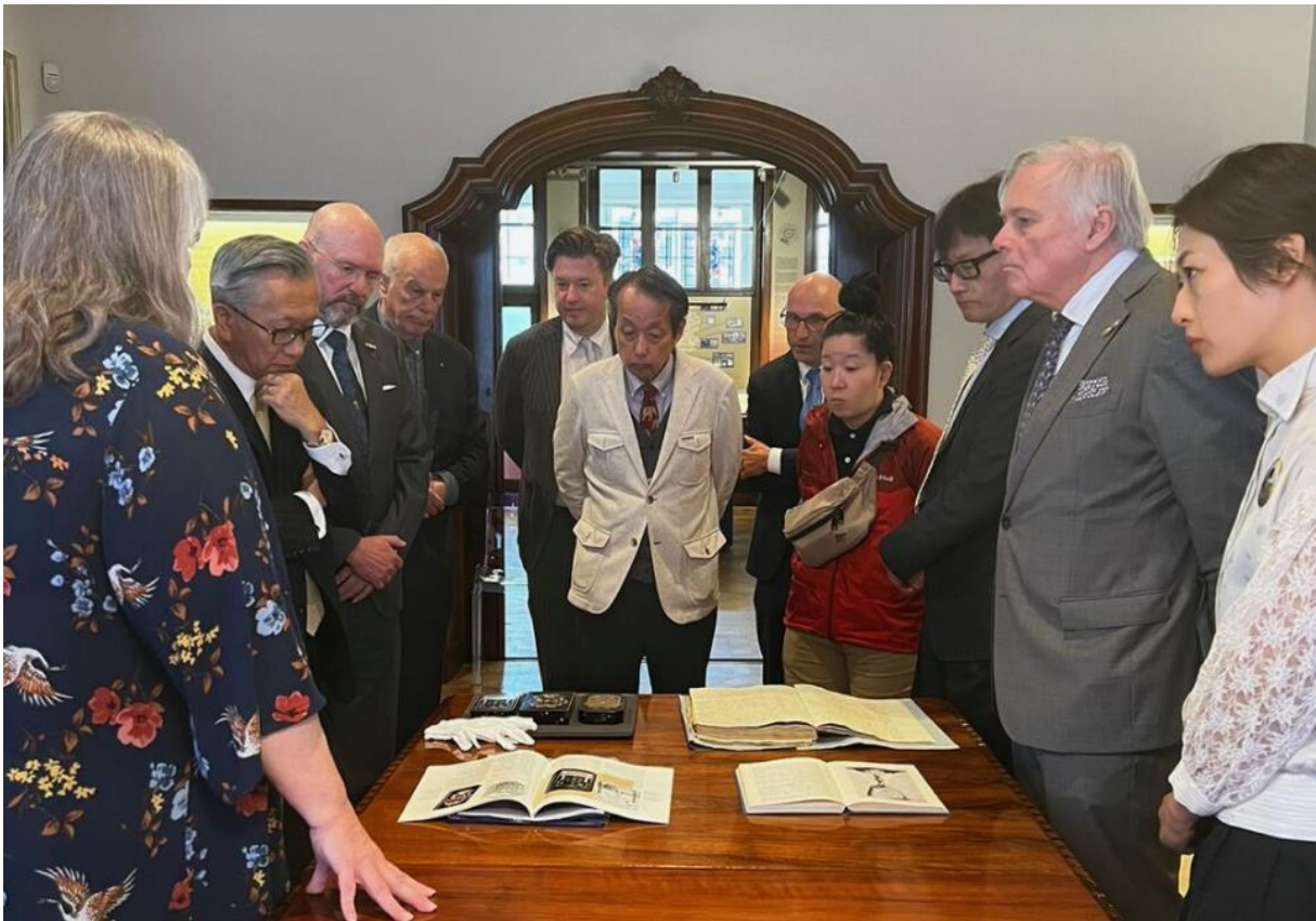
Vertegenwoordigers van de Universiteit van Toyama met afgevaardigden van Waza no Michi in het Vrijmetselarij Museum. Het bezoek vormde de aanzet voor het NIMARP-onderzoeksplan.