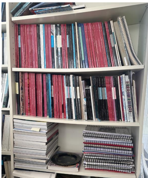
Fragment van een grote schenking veilingcatalogi t.b.v. de Waza no Michi bibliotheek (momenteel in tijdelijke opslag)

Dit verslag is verder voorzien van een baten en lasten weergave, resultatenrekening en balans .